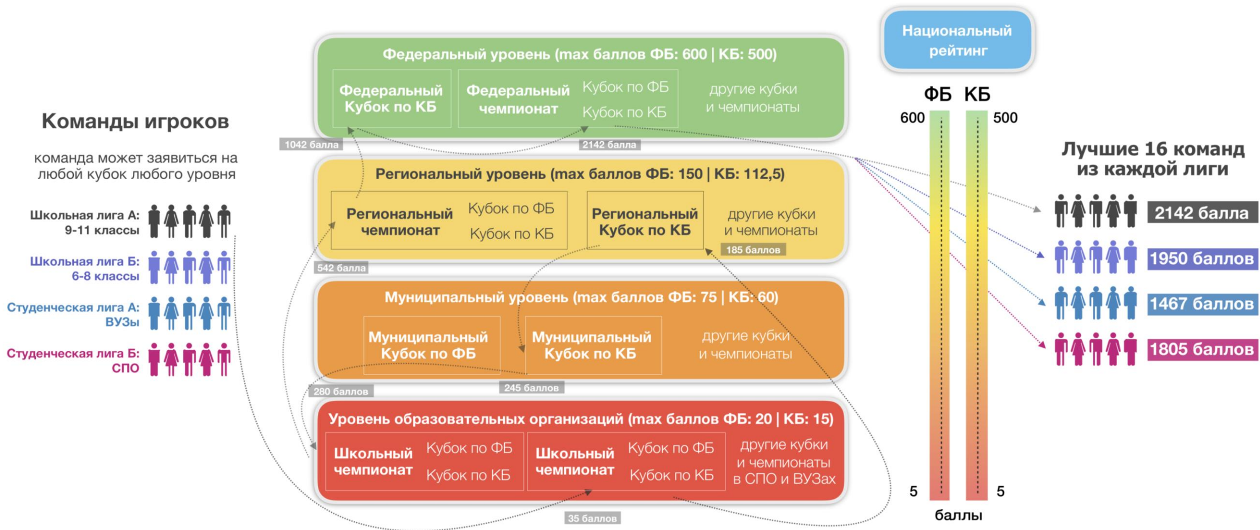
Схема проведения II Всероссийского чемпионата по финансовой грамотности (2020 - 2021)

вариант участия одной команды в Чемпионате